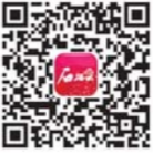
ئانار بۇلۇت تېرەمئالىى جۇمئۇرۇپ قاجىلۇبىلىك

شىنجاڭ گېزىتخانىسى نەشر قىلدى مەملىكەت ئىچىدە بىرلىككە كەلگەن ئۇدا نەشر بۇيۇمى نومۇرى: W-000662-CN پوچتا ۋاكالەت نومۇرى: 1-57 تيانشان تورى: www.ts.cn