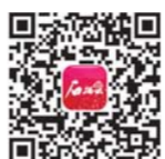
ئانار بۇلۇت تېرەپىنىڭ جۇمھۇرىيەت قانۇنچىسى