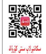
ئىككىنچى قېتىملىق ئۇرۇمچى

يېقىنقى يىللاردىن بۇيان، پۈتۈن ئاپتونوم رايوندىكى يېزا ئىگىلىكى، يېزا تارماقلىرى يېشىل تەرەققىياتى گەۋدىلىك ئورۇنغا قويۇشتا چىڭ تۇرۇپ، يېزا ئىگىلىكىنىڭ تەرەققىيات شەكلىنى تېز ئۆزگەرتىپ، ئىلگىرىكى ئاساسلىق بايلىققا چىتىپ قويۇش، خوروتشقا چىتىپ قويۇشقا تايىنىشىنى تەدرىجىي ھالدا ئىسپاتلىدى. سىجىل تەرەققىياتقا ئۆزگەرتىپ، يېزا ئىگىلىكى ھوسۇلىنى مۇقىم ئاشۇرۇش بىلەن بىللە، بۇلغىما قويۇپ بېرىشنى بارغانسېرى ئازايتتى، يېشىل تەرەققىياتنىڭ ئاساسى بارغانسېرى روشەنلەشتى، يېزا ئىگىلىكىنى سۈپەت ئارقىلىق گۈللەندۈرۈش، يېزا ئىگىلىكىنى ئۈنۈم ئارقىلىق گۈللەندۈرۈش، يېزا ئىگىلىكىنى يېشىل گۈللەندۈرۈش يېڭى ئەندىزىسى شەكىللەندۈردى. يېشىل ئىشلەپچىقىرىش ئومۇملاشتى يېشىل يېزا ئىگىلىكى، ساغلام يېمەك-