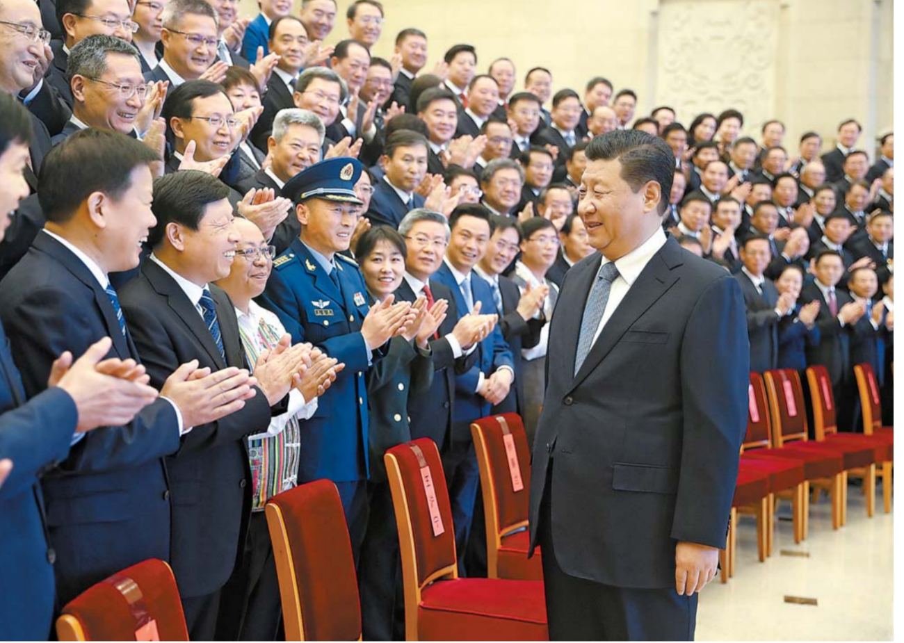
11 - ئاينىڭ 20 - كۈنى، پارتىيە ۋە دۆلەت رەھبەرلىرىدىن شى جىنپىڭ، ۋاڭ خۇنىڭ قاتارلىقلار بېيجىڭدا مەملىكەتلىك مەنئىي مەدەنىيەت قۇرۇلۇشى بويىچە تەقدىرلەش يىغىنى ۋە كەڭلىرى بىلەن كۆرۈشتى.

خەلقنىڭ بەخت - سائادىتىگە مۇناسىۋەتلىك، دۇنيانىڭ كەلگۈسىگە مۇناسىۋەتلىك. شى جىنپىڭ مۇنۇلارنى تەكىتلىدى: بىز ئاسىيا - تىنچ ئوكيان ئىقتىسادىي ھەمكارلىق تەشكىلاتىنىڭ 2020 - يىلىدىن كېيىنكى ھەمكارلىق مەنزىلىنى ئېچىشنى يېڭى باشلىدىم. ئاسىيا - تىنچ ئوكيان ھەمكارلىقىنىڭ يېڭى باسقۇچىنى ئېچىپ، (ئاخىرى 2 - بەتتە)