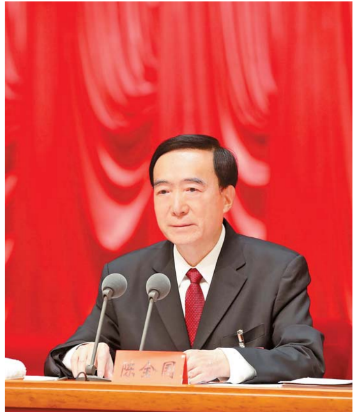
10 - ئاينىڭ 9 - كۈنىدىن 10 - كۈنىگىچە، جۇڭگو كوممۇنىستىك پارتىيەسى شىنجاڭ ئاپتونوم رايونلۇق 9 - نۆۋەتلىك كومىتېتى 10 - ئومۇمىي يىغىنىنى ئۆزگەرتىش ۋە ئۆزگەرتىش ئىشلىرىنى ئۆتكۈزۈۋالدى. ئاپتونوم رايونلۇق پارتىيە كومىتېتىنىڭ ۋىجيان چىن چۈەنگو يىغىنىغا قاتناشتا ھەم سۆز قىلدى. □ پۈتۈن تارقاتقۇ مۇخبىرىمىز سۈي جىيەن فونۇسى