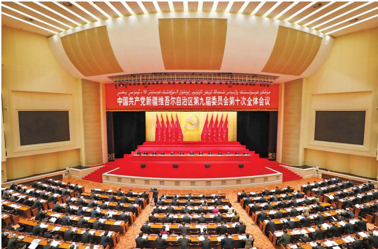
10 - ئاينىڭ 9 - كۈنىدىن 10 - كۈنىگىچە، جۇڭگو كوممۇنىستىك پارتىيەسى شىنجاڭ ئاپتونوم رايونلۇق 9 - نۆۋەتلىك كومىتېتى 10 - ئومۇمىي يىغىنىنى ئۆزگەرتىش ۋە ئۆزگەرتىش ئىشلىرىنى ئۆتكۈزۈۋالدى. سۈرەتتە: يىغىن مەيدانى. □ پۈتۈن تارقاتقۇ مۇخبىرىمىز سۈي جىيەن فونۇسى

«جۇڭگو كوممۇنىستىك پارتىيەسى شىنجاڭ ئاپتونوم رايونلۇق 9 - نۆۋەتلىك كومىتېتى 10 - ئومۇمىي يىغىنىنىڭ 3 - قېتىملىق مەركەز شىنجاڭ خىزمىتى سۆھبىتى يىغىنىنىڭ روھىنى چوڭقۇر ئۆزگەرتىش، تەشۋىق قىلىش، ئىزچىللاشتۇرۇش، جاسارەت بىلەن يېڭى دەۋردىكى شىنجاڭ خىزمىتىدە يېڭى ۋەزىيەت يارىتىش توغرىسىدىكى قارارى» قاراپ چىقىپ ماقۇللاندى ئاپتونوم رايونلۇق پارتىيە كومىتېتى دائىمىي يىغىنىغا رىياسەتچىلىك قىلدى چېن چۈەنگو سۆز قىلدى