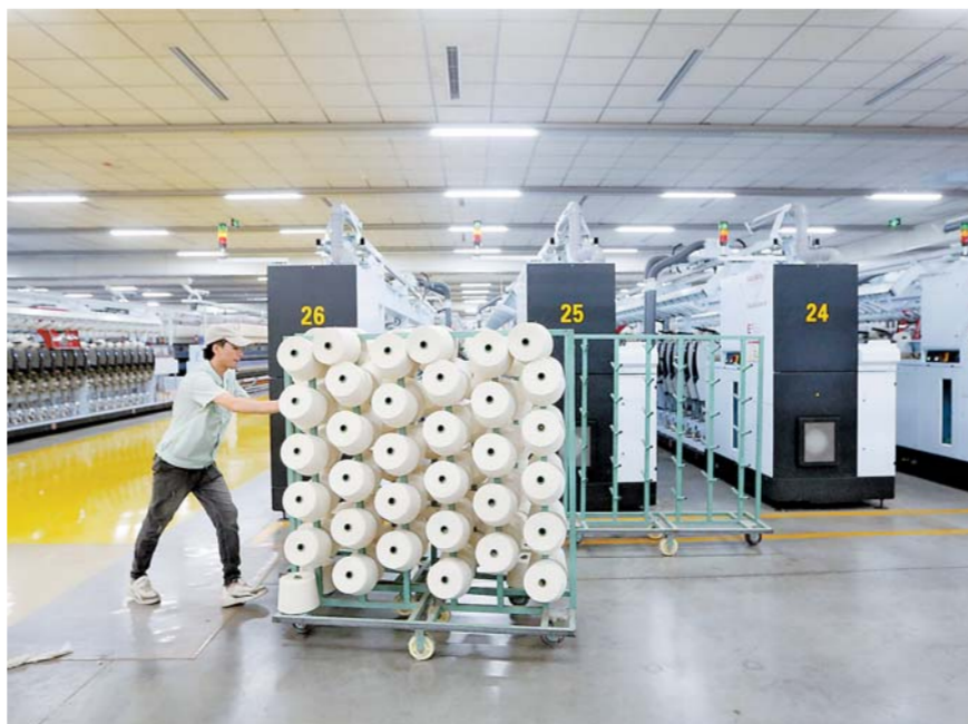
6 - ئاينىڭ 15 - كۈنى، ئىككى يىغىنار ناھىيەسىدىكى بىر توقۇمىچى - لىق، كىيىم كېچەك كارخانىسىنىڭ سېخىدا ئىشلەپچىقىرىش، ئىككىنچى، بۇ شىركەت شۇ جايدىكى 460 نەپەر يېزا ئارتۇق ئەمگەك كۈچىنى ئىشقا ئورۇنلاشتۇرغان. □ پۈتۈن تاراتقۇ مۇخبىرىمىز لى رۇي فوتوسى

يىل ئاپتونوم رايونىمىزدىكى ئالىي مە - كەپنى پۈتكۈزگەنلەرنىڭ ئىشقا ئورۇنلىشىش نىسبىتىنىڭ 88% تىن ئېشىشىغا ھەققىي كاپالەتلىك قىلىش كېرەك. شىغا بىر قەدەر زور تەسىر كۆرسەتتى. يى - قىندا، ئاپتونوم رايونلۇق يېڭى تىپتىكى تاجىسمان ۋىرۇسلۇق ئۆپكە ياللوغى يۇ - قۇمىنىڭ ئالدىنى ئېلىش - تىزگىنلەش خىزمىتى قوماندا ئىستىپا «2020 - يىلى ئالىي مەكتەپنى پۈتكۈزگەنلەرنىڭ يىل ئاخىرىدا ئىشقا ئورۇنلىشىش نىسبىتىنى 88% تىن ئاشۇرۇشقا ھەققىي كاپالەتلىك قىلىشنى تەلەپ قىلدى. (ئاخىرى 4 - بەتتە)