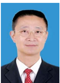
لەن خۇينىڭ سۆزى. شىنخۇا ئا. □ شىنخۇا ئا. كېڭىيىش ئارقىلىق

خەلق ئىشلىرىنى قەلبىدە ئەڭ يۇقىرى ئورۇندۇرغاندا، ئۇ ھەر ۋاقىت «يا غۇقى كە-رىچتە تۇرغاندەك» خىزمەت ھالىتىنى ساقلاپ، ئۆزىنى ئۆپمە-راتسىمۇ، خىزمەتنى ئاڭ-سىتىپ قويىمىغان. ۋېن-چۈەندىكى پەۋقۇلئاددە زور يەر تەۋرەشكە تا-قابىل تۇرۇشتا، ئۇ يەر تەۋرەش ئىپتىتىگە تاقابىل تۇرۇپ، ئاپەتتىن قۇتقۇزۇشنىڭ ئەڭ ئالدىنقى سېپىدە چىڭ تۇرۇپ، قازا قىلغان ئۇچ تۇغىنىنى ئىزدەشكە ۋاقىت ئاڭ-رىتالىي، كەينى - كەينىدىن «ھايات-لىق لىنىيەسى»نى راۋانلاشتۇرۇشنى تەشكىللىگەن؛ ئاپەتتىن كېيىنكى قايتا قۇرۇشتا، ئۇ قاتناش - ترانسپورت، بىخەتەر ئىشلەپچىقىرىش قاتارلىق ئەڭ مۇشكۈل، ئەڭ جاپالىق خىزمەت ۋەزىپىسىنى باتۇرلۇق بىلەن ئۈستىگە ئېلىپ، ئاممىنىڭ «خاتىرجەم يول»دا مېڭىشىغا كاپا-لەتلىك قىلىپ، بېيجۇەندە ئۇچ يىل ئېغىر، زور بىخەتەرلىك ھادىسىسى لەن خۇينىڭ خىزمەتتىكى چىن گۈشىڭ مۇنداق دېدى: خىزمەت ئالدىراش بولغاچقا، لەن خۇي بەزىدە بىر كۈندە ئاران ئىككى - ئۈچ ساگەتلا ئارام ئالغىنى، چارچىغاندا، ئۇ ئۇيغۇسى كەلگەندە ئاڭ-تومۇبىلىدا بىردەم بېتىۋالغىنى. بويى 1.72 مېتىر بولسىمۇ، ئېغىرلىقى 60 كىلوگرامغا يەتمەيتتى، ئۇنىڭدا بوۋا-سىر، مەقەت ئاقمىسى كېسىلى بولۇ-پلا قالماي، يەنە ناھايىتى ئېغىر گاش-قازان كېسىلى، جىگەر كېسىلى بار ئىدى. «ئادەم ئۆزىنىلا ئويلىمىسا، باشقىلارنى كۆپرەك ئويلىشى كېرەك.» بۇ لەن خۇينىڭ غايىسى بولۇپ، مەيلى ئادەم بولۇشتا ياكى ئەمەلدار بولۇشتا بولسۇن، ئۇ بۇنىڭغا ئەمەل قىلغان. ئۇ ھەمىشە ئاممى-نىڭ ئىشىنى چوڭ ئىشى دەپ قاراپ پۈتۈن ھېسسىياتى بىلەن كۆڭۈل بۆلۈپ، كۆڭۈل قويۇپ ئىشلىگەن، كىشىلەر لەن خۇي قىشتىكى ئوتقا