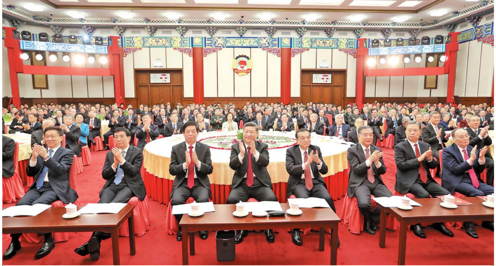
12 - ئاينىڭ 31 - كۈنى، مەملىكەتلىك سىياسىي كېڭەش بېيجىڭدا يېڭى يىللىق چاي سۆھبىتى ئۆتكۈزۈلدى. پارتىيە ۋە دۆلەت رەھبەرلىرىدىن شى جىنپىڭ، لى كېچياڭ، لى جەنشۈ، ۋاڭ ياك، ۋاڭ خۇنىڭ، جاۋ لېجى، خەن جېڭ، ۋاڭ چىشەن چاي سۆھبىتىگە قاتناشتى ھەم ئۈيۈن كۆردى.

لى كېچياڭ، لى جەنشۈ، ۋاڭ خۇنىڭ، جاۋ لېجى، خەن جېڭ، ۋاڭ چىشەن قاتناشتى ۋاڭ ياك رىياسەتچىلىك قىلدى