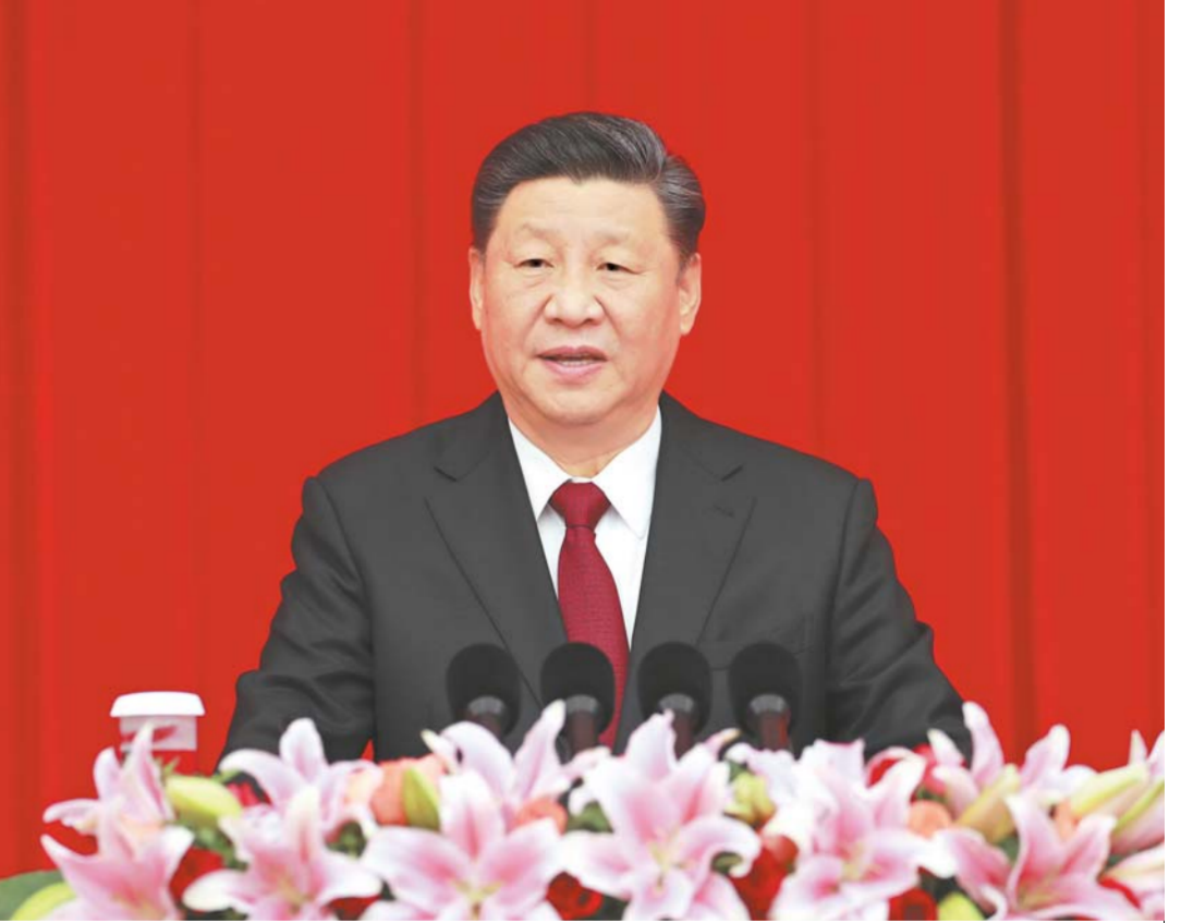
12 - ئاينىڭ 31 - كۈنى، مەملىكەتلىك سىياسىي كېڭەش بېيجىڭدا يېڭى يىللىق چاي سۆھبىتى ئۆتكۈزۈلدى. جۇڭگو كوممۇنىستىك پارتىيەسى مەركىزىي كومىتېتىنىڭ باش شۇجىسى، دۆلەت رەئىسى، مەركىزىي ھەربىي كومىتېتىنىڭ رەئىسى شى جىنپىڭ چاي سۆھبىتىدە مۇھىم سۆز قىلدى.

شىنخۇئا ئاگېنتلىقى، بېيجىڭ، 12 - ئاينىڭ 31 - كۈنى تېلېگراممىسى (مۇخبىر لى ياك ۋېيخەن، لىن خۇي) جۇڭگو خەلق سىياسىي مەسلىھەت كېڭىشى مەملىكەتلىك كومىتېتى 12 - ئاينىڭ 31 - كۈنى چۈشتىن بۇرۇن مەملىكەتلىك سىياسىي كېڭەش زالىدا يېڭى يىللىق چاي سۆھبىتى ئۆتكۈزۈلدى. پارتىيە ۋە دۆلەت رەھبەرلىرىدىن شى جىنپىڭ، لى كېچياڭ، لى جەنشۈ، ۋاڭ ياك، ۋاڭ خۇنىڭ، جاۋ لېجى، خەن جېڭ، ۋاڭ چىشەن قاتارلىقلار ھەرقايسى دېموكراتىك پارتىيە - گۇرۇھلار مەركىزىي كومىتېتىلىرى، مەملىكەتلىك سودا - سانائەتچىلەر بىرلەشمىسىنىڭ مەسئۇللىرى ۋە پارتىيە - گۇرۇھسىز زاتلار ۋەكىللىرى، مەركەز ۋە دۆلەت ئورگانلىرىدىكى ئالاقىدار تەرەپلەرنىڭ مەسئۇللىرى ھەمدە پادىتەختتىكى ھەر مىللەت، ھەر ساھە زاتلىرى ۋەكىللىرى بىلەن خۇشال - خۇرام جەم بولۇپ، 2020 - يىللىق يېڭى يىلنى خۇشال كۈتۈۋالدى. جۇڭگو كوممۇنىستىك پارتىيەسى مەركىزىي كومىتېتىنىڭ باش شۇجىسى، دۆلەت رەئىسى، مەركىزىي ھەربىي كومىتېتىنىڭ