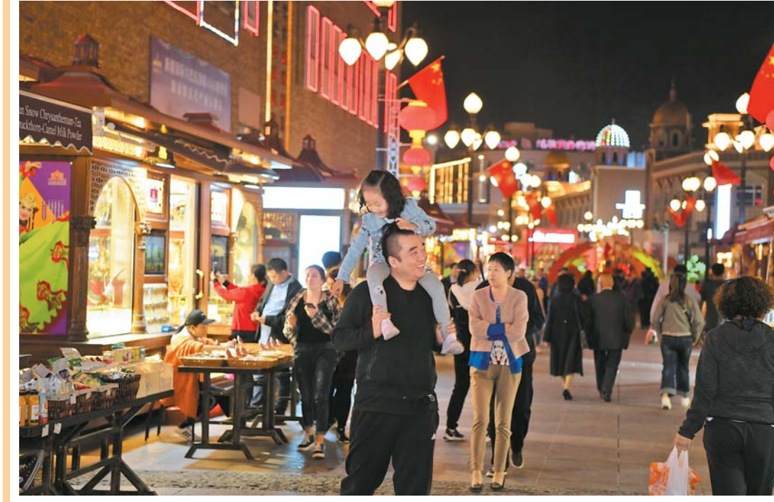
چوڭ بازار قىزىپ كەتتى 9 - ئاينىڭ 14 - كۈنى كەچتە، شىنجاڭ خەلقئارا چوڭ بازار مەنزىرە رايونىدا ساياھەتچىلەرنىڭ ئايغى ئۇزۇلدى. □ مۇخبىرىمىز جوۋ يۇڭجىياڭ فوتوسى