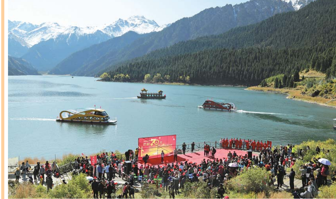
بوغدا كۆلى ساياھەتچىلەر بىلەن لىق تولدى 9 - ئاينىڭ 13 - كۈنى، نۇرغۇن ساياھەتچى تىبىئىيەت بۇغدا كۆلى مەنزىرە رايونىدا ساياھەت قىلماقتا.