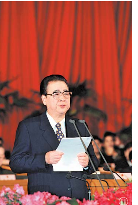
سۈرەت ⑪: 1998 - يىلى 3 - ئاينىڭ 19 - كۈنى، 9 - نۆۋەتلىك مەملىكەتلىك خەلق قۇرۇلتىيىنىڭ 1 - يىغىنى بېيجىڭ خەلق سارىيىدا غەلبىلىك يىپىلدى، يولداش لى پىڭ يىپىش مۇراسىمدا سۆز قىلدى.