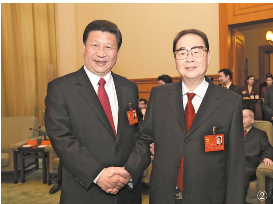
سۈرەت ②: 2012 - يىلى 11 - ئاينىڭ 14 - كۈنى، پارتىيە 18 - قۇرۇلتىيى يىپىش ئالدىدا، يولداش شى جىنپىڭ يولداش لى پىڭ بىلەن بىللە.