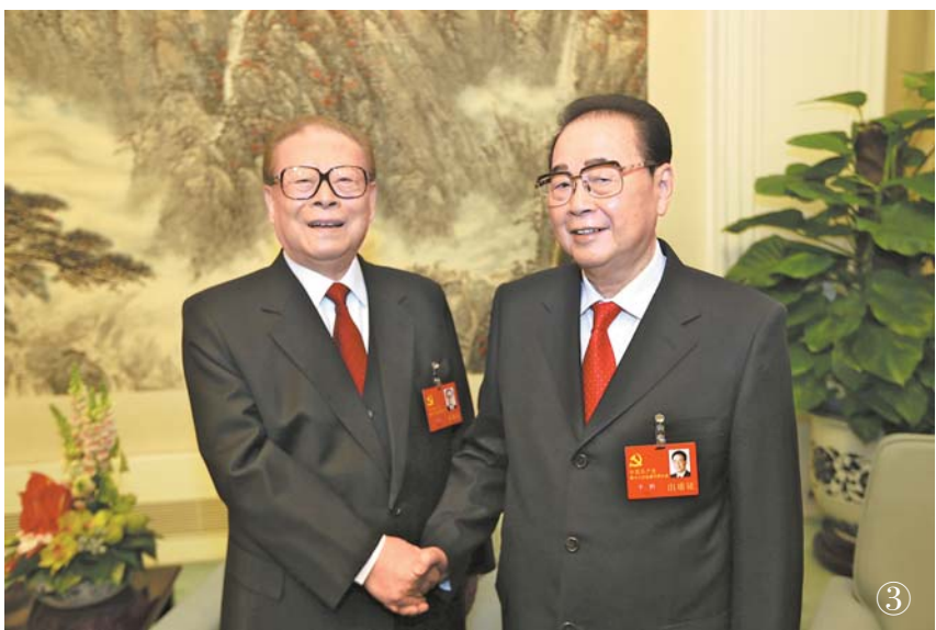
سۈرەت ③: 2012 - يىلى 11 - ئاينىڭ 8 - كۈنى، پارتىيە 18 - قۇرۇلتىيى ئېچىلىش ئالدىدا، يولداش جىياڭ زېمىن يولداش لى پىڭ بىلەن بىللە.