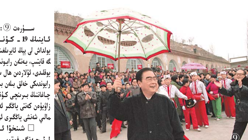
سۈرەت ⑨: 1996 - يىلى 2 - ئاينىڭ 19 - كۈنىدىن 20 - كۈنىگىچە، يولداش لى پىڭ ئايرىلىقىغا 50 يىل بولغان پەنەندە، گە قايىتىپ، يەنەن رايونىدىكى كادىرلار، ئاممىنى يوقلىدى، ئۇلاردىن ھال سورىدى، كونا ئىنقىلابىي رايوندىكى خەلق بىلەن بىرلىكتە چاغان ئۆتكۈزدى. چاغاننىڭ بىرىنچى كۈنى، يولداش لى پىڭ زاۋۇەن كەنتى ياڭگىر ئەترىتى بىلەن بىرلىكتە شەخىي شەنشى ياڭگىرى ئۆيىنىدى.