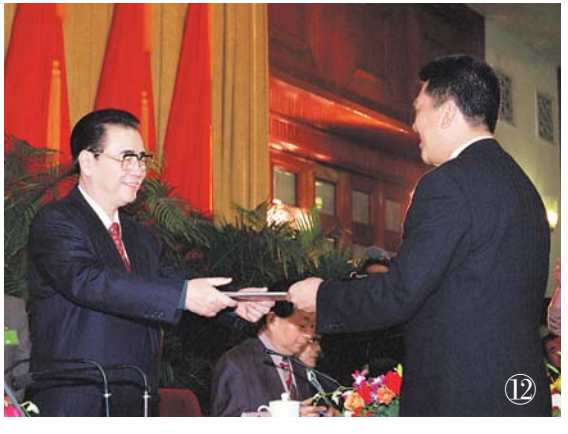
سۈرەت ⑫: 1998 - يىلى 5 - ئاينىڭ 5 - كۈنى، مەملىكەتلىك خەلق قۇرۇلتىيى ئاۋمېن ئالاھىدە مەمۇرىي رايونى قۇرۇشقا تەييارلىق كۆرۈش كومىتېتى بېيجىڭ خەلق سارىيىدا قۇرۇلغاندا، قىنى جاكارلىدى ھەم بىرىنچى قېتىملىق ئومۇمىي يىغىن ئۆتكۈزۈدى. يولداش لى پىڭ تەييارلىق كۆرۈش كومىتېتىنىڭ مۇئاۋىن مۇدىر ئەزاخى خۇخۇئاغا تەيىننامە بەردى.