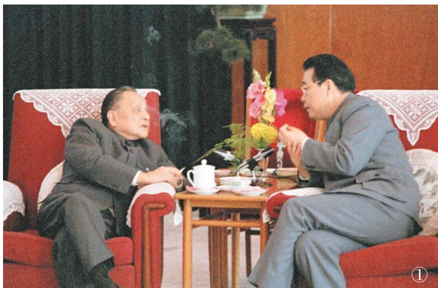
سۈرەت ①: 1988 - يىلى، يولداش دېڭ شياۋپىڭ بىلەن يولداش لى پىڭ بېيجىڭ خەلق سارىيىنىڭ فۇجيەن زالىدا پاراڭلاشماقتا.