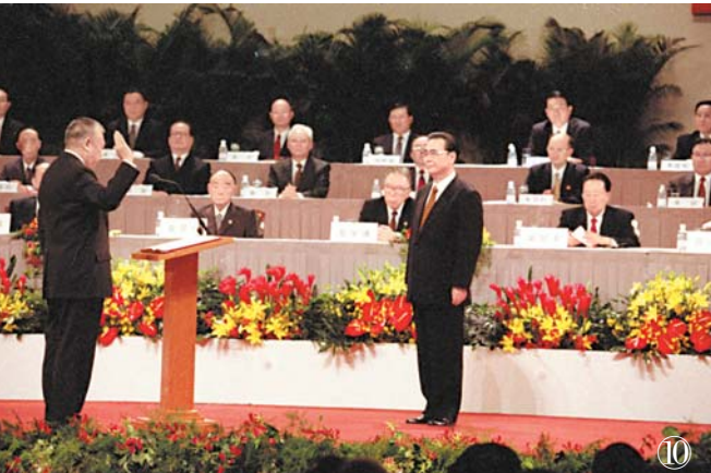
سۈرەت ⑩: 1997 - يىلى 7 - ئاينىڭ 1 - كۈنى سەھەر - دە، جۇڭخۇا خەلق جۇمھۇرىيىتى شياڭگاڭ ئالاھىدە مەمۇرىي رايونىنى قۇرۇش ھەم ئالاھىدە مەمۇرىي رايون ھۆكۈمىتىنىڭ قەسەم بېرىپ ۋەزىپىگە ئولتۇرۇش مۇراسىمى شياڭگاڭ يىغىنى - كۆزگەزەم مەركىزىدىكى شىنشى بىناسىنىڭ 7 - قەۋىتىدە داغدۇغىلىق ئۆتكۈزۈلدى. شياڭگاڭ ئالاھىدە مەمۇرىي رايونىنىڭ تۇنجى باش مەمۇرىي دۇڭ جىيەنخۇا قەسەم بېرىپ ۋەزىپىگە ئولتۇردى، يولداش لى پىڭ قەسەم بېرىشنى نازارەت قىلدى.