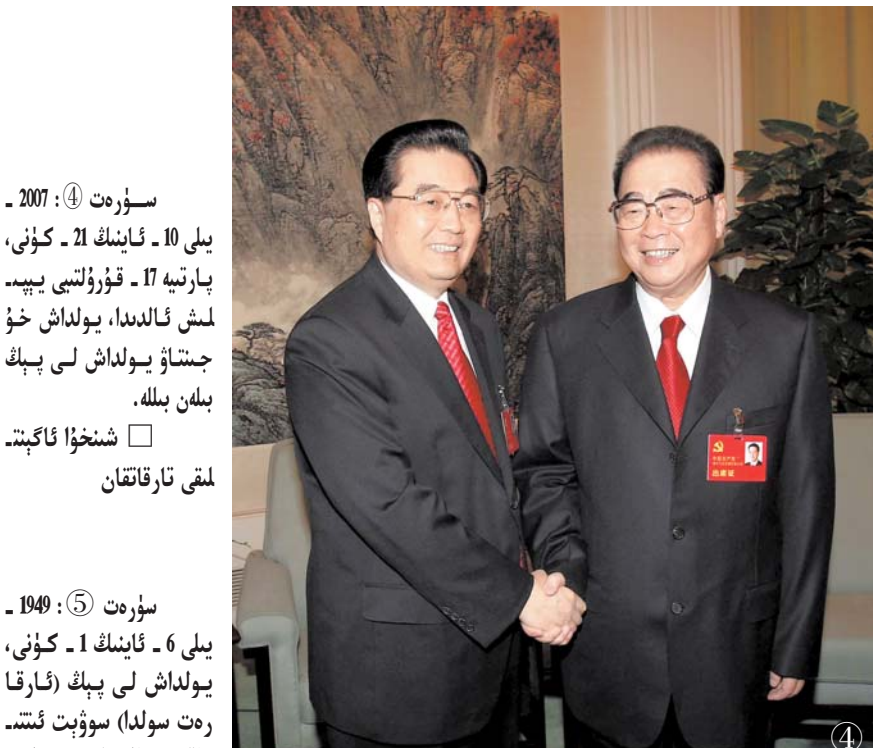
سۈرەت ④: 2007 - يىلى 10 - ئاينىڭ 21 - كۈنى، پارتىيە 17 - قۇرۇلتىيى يىپىش ئالدىدا، يولداش خۇ جىتاۋ يولداش لى پىڭ بىلەن بىللە.

1979 - يىلى 4 - ئايدىن باشلاپ، يولداش لى پىڭ ئىلگىرى - كېيىن بولۇپ ئېلىكتىر ئېنېرگىيە سانائىتى مىنىستىرلىقىنىڭ مۇئاۋىن مىنىستىرى، پارتگۇرۇپپىسىنىڭ ئەزاسى، قوشۇمچە شىمالىي جۇڭگو توك ئىشلىرى باشقۇرۇش ئىدارىسى پارتگۇرۇپپىسىنىڭ شۇجىسى، ئېلىكتىر ئېنېرگىيە سانائىتى مىنىستىرلىقىنىڭ مىنىستىرى، پارتگۇرۇپپىسىنىڭ شۇجىسى،