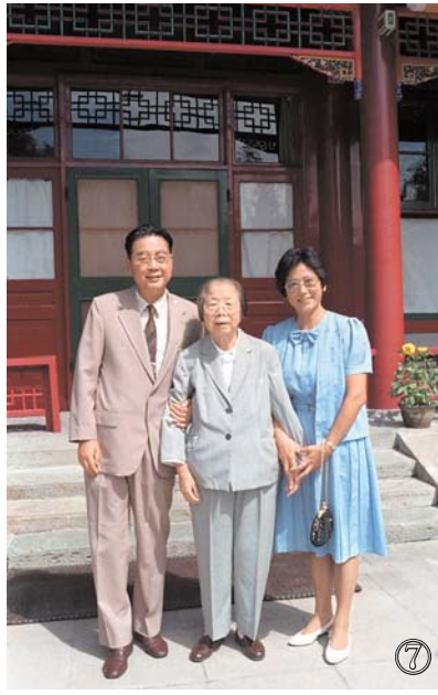
سۈرەت ⑦: 1986 - يىلى، يولداش لى پىڭ ۋە يولداش ھەم رەھبىسى جۇ لى پىڭ جۇڭخۇا ئىنقىلابىي شۇنچاڭ ئىدارىسىگە چۈشكەن سۈرەت.