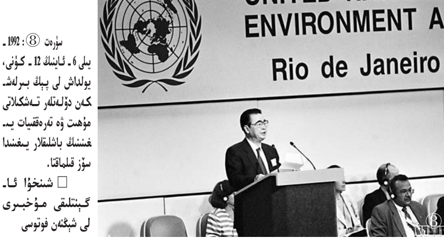
سۈرەت ⑧: 1992 - يىلى 6 - ئاينىڭ 12 - كۈنى، يولداش لى پىڭ بىرلەشكەن دۆلەتلەر تەشكىلاتى مۇھىت ۋە تەرەققىيات يىغىنىنىڭ باشلىقلار يىغىنىدا سۆز قىلماقتا.